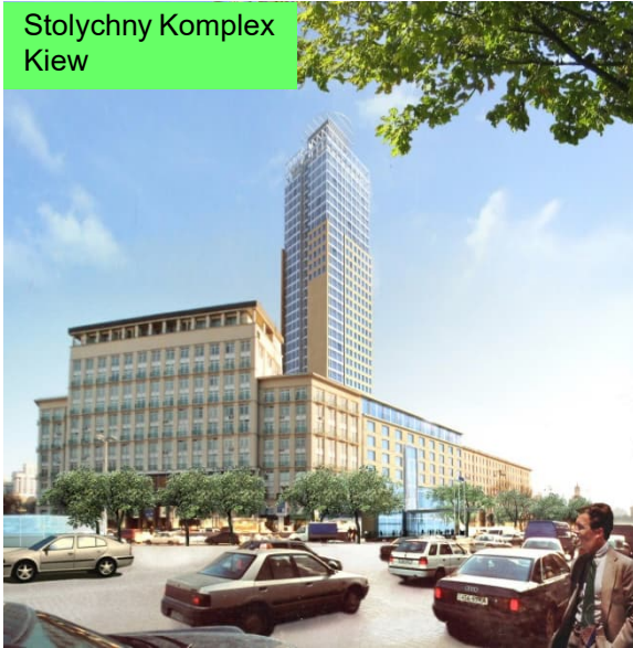
Stolychny Komplex Kiew