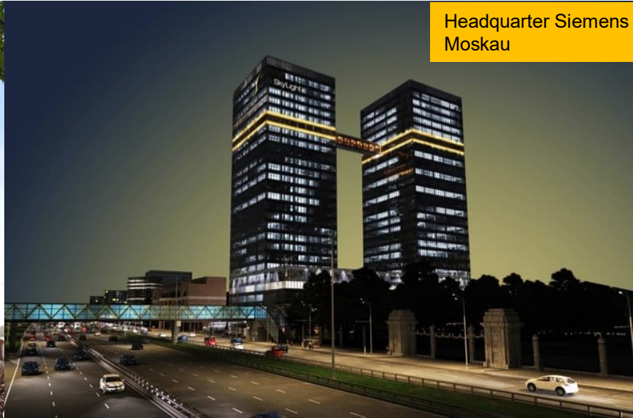
Headquarter Siemens Moskau