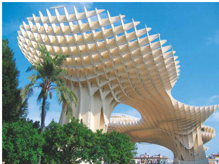
■ Metropol Parasol in Sevilla © Harrer Ingenieure GmbH